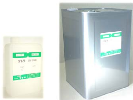
1 kg ポリ入