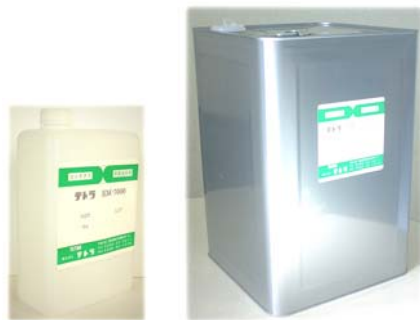
1 kg 角ポリ入 17kg 角缶入